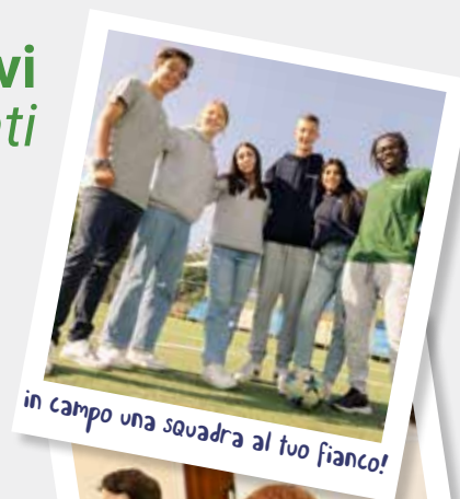
in campo una squadra al tuo fianco!