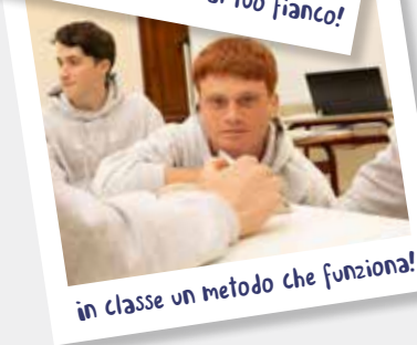
in classe un metodo che funziona!