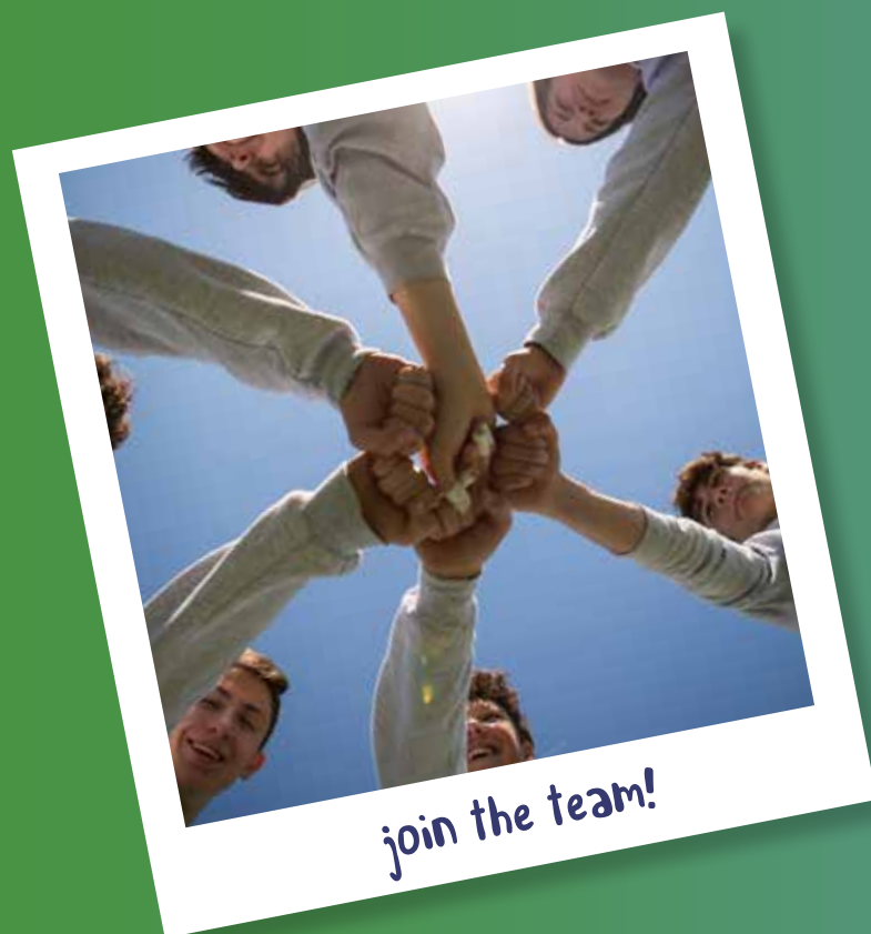
join the team!

Your school, your sport: your team! Florentia Sport School, la scuola che fa il tifo per te!